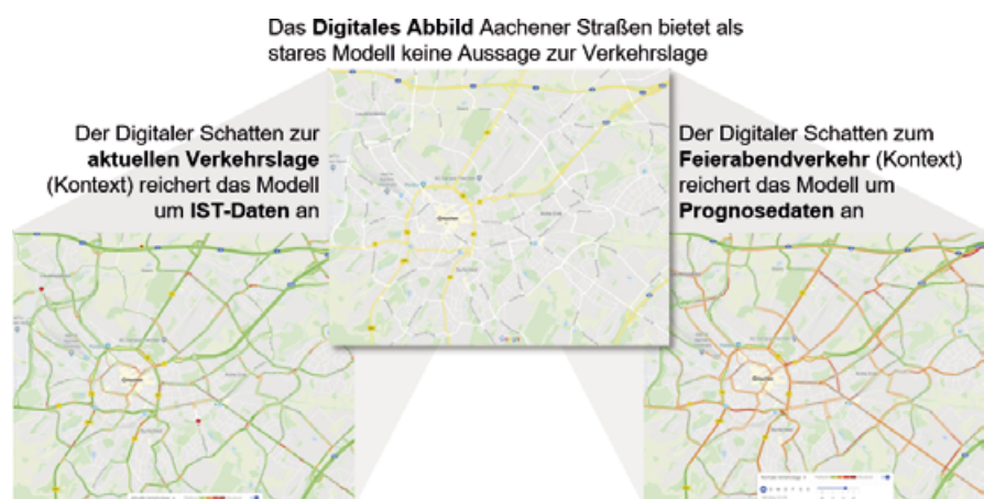
Bild 1. Beispielhafte Digitale Schatten dynamischer Daten in dem von Google Maps gebotenen Strukturmodell

Analog zu Google Maps lassen sich Fertigungsaufträge in der Produktion ebenfalls anhand ihrer starren Merkmale (notwendigen Arbeitsschritte, durchschnittlichen Durchlaufzeiten) in den Produktionsablauf einlasten, doch wird der Fertigstellungstermin erst durch Einbeziehen der aktuellen Auslastung und etwaiger Maschinenausfälle verlässlich planbar. Aufgrund der komplexen Wirkbeziehungen in der Produktionstechnik werden im Exzellenzcluster „Internet of Production“ daher Methoden entwickelt, um Digitale Schatten in der Produktion flexibel zu generieren und zur datengestützten Optimierung der Prozesse zu nutzen.